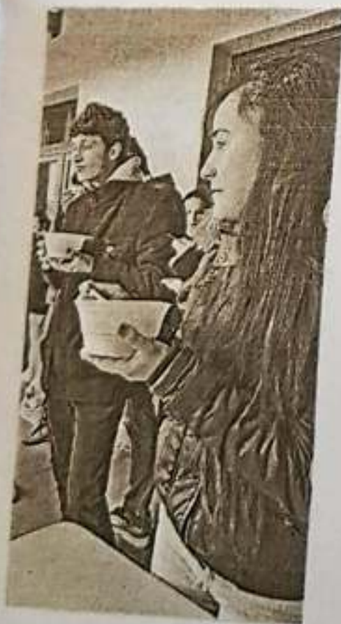
Az ebéd pedig finom volt és kész!

Volt aki „vakon” bizott a játékvezetőben és „kezét lábát törte”, hogy részt vehessen a játékban!