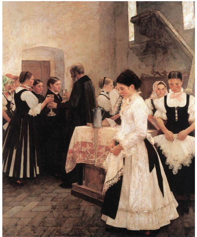
Csók István: „Ezt cselekedjétek az én emlékezetemre!” (Úrvacsora) 1890.

Szeretettel hívjuk és várjuk gyülekezetünk tagjait mindkét alkalomra! Tudjuk, hogy ez lemondással is jár, de a konfirmáció alkalmával gyülekezetünk úrvacsorával élhető tagjaivá fogadjuk a fiatalokat és felnőtteket, így a közösség jelenlétére nagyon számítunk!